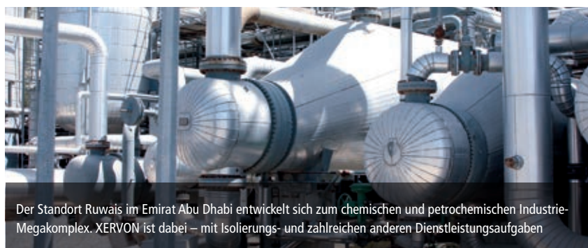
Der Standort Ruwais im Emirat Abu Dhabi entwickelt sich zum chemischen und petrochemischen Industrie-Megakomplex. XERVON ist dabei – mit Isolierungs- und zahlreichen anderen Dienstleistungsaufgaben