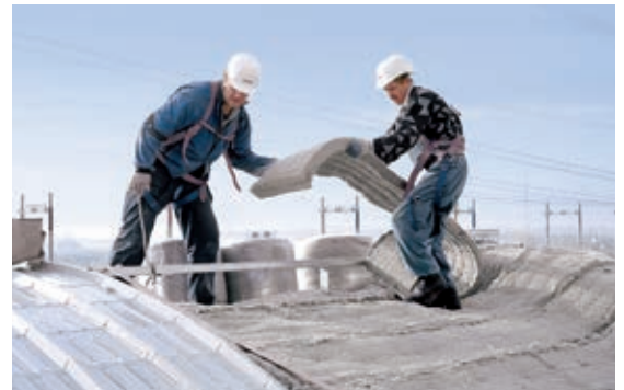
Wo immer Sie uns brauchen: Das Know-how unserer erfahrenen Spezialisten macht auch an schwer zugänglichen Stellen nicht halt