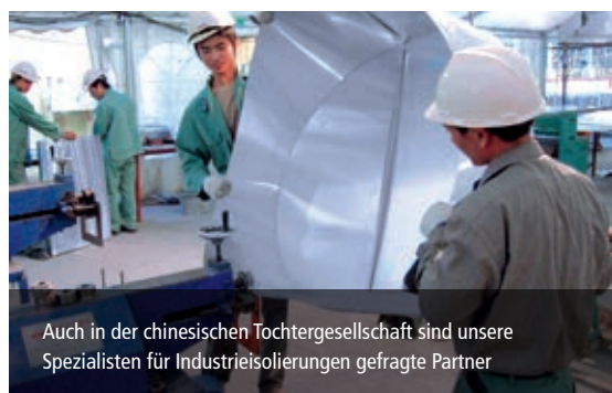
Auch in der chinesischen Tochtergesellschaft sind unsere Spezialisten für Industriehisierungen gefragte Partner

XERVON schafft Lösungen nach Maß. Dabei ist das moderne Equipment ebenso ein Garant für Qualität wie die langjährige, spezifische Projekterfahrung unserer Mitarbeiter